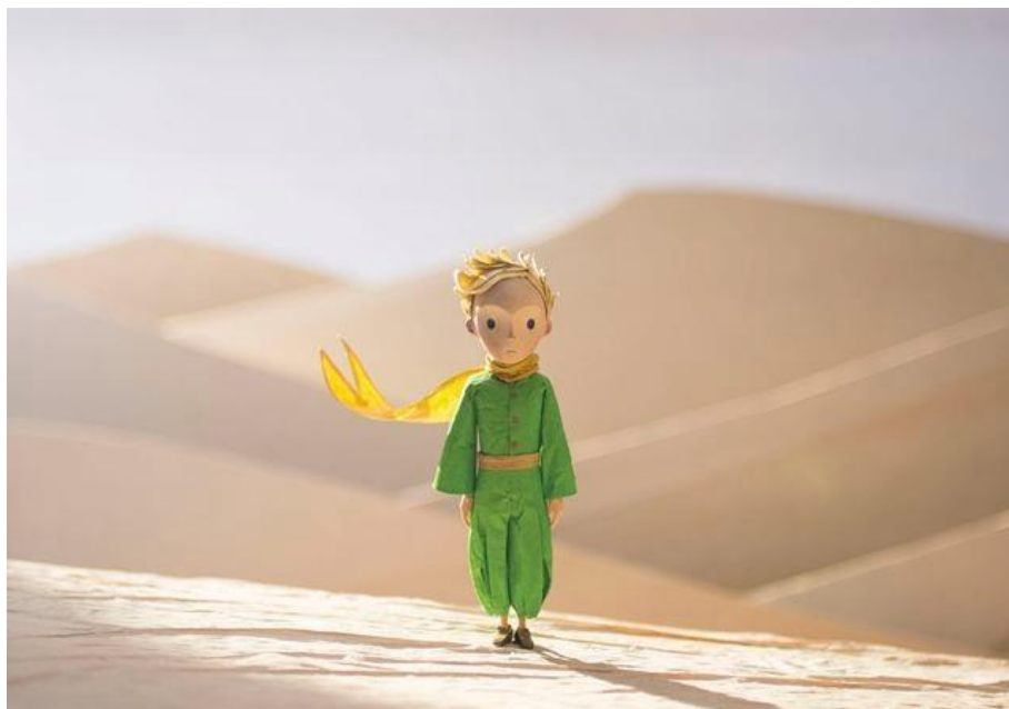
(Immagine tratta da Il Piccolo Principe , Antoine De Saint-Exupéry)